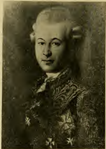
СЕМЕНЪ ГАВРИЛОВИЧЪ графъ ЗОРИЧЪ.

Основанный извѣстнымъ генер. Зоричемъ въ 1778-мъ году, — въ «славный вѣкъ Екатерины», въ эпоху блистательныхъ побѣдъ Генералиссимуса Князя Италійскаго —