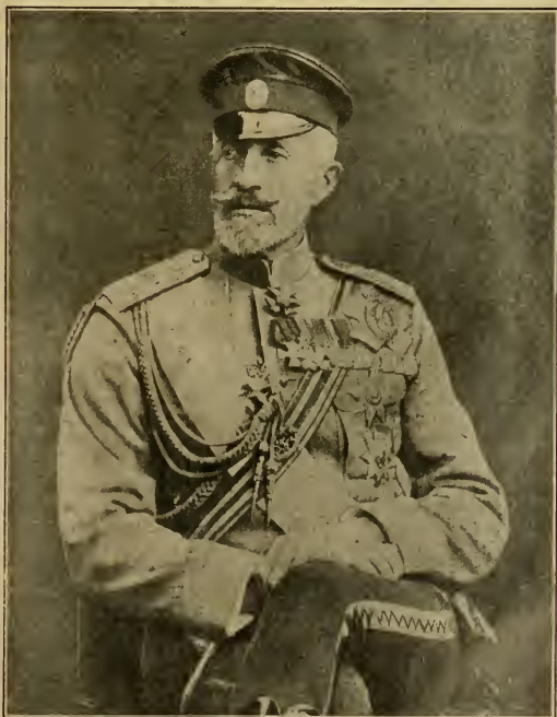
† Верховный Главнокомандующій, Его Императорское Высочество Великій Князь НИКОЛАИ НИКОЛАЕВИЧЪ