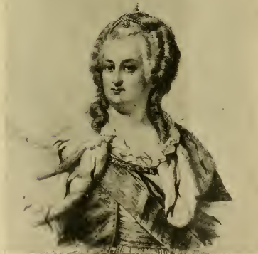
ИМПЕРАТРИЦА ЕКАТЕРИНА II.

Державная основательница 1-го Моск. Кад. Корпуса.